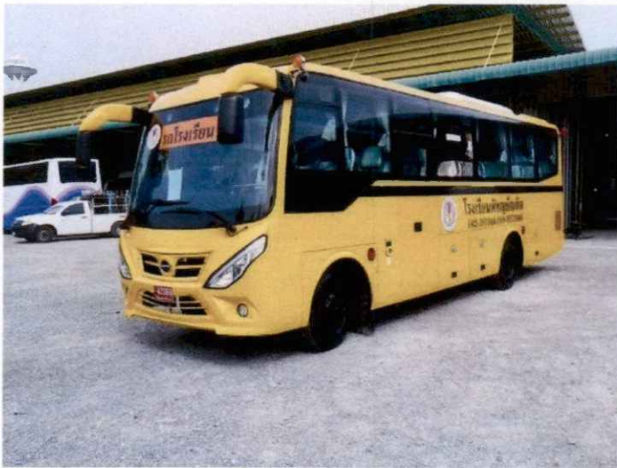
ประเภทที่ ๑ ได้แก่ รถโรงเรียน (โรงเรียนบริหารจัดการด้วยตนเอง)

ประเภทที่ ๑ รถโรงเรียน (โรงเรียนบริหารจัดการด้วยตนเอง) รถโรงเรียน หมายถึง รถรับ-ส่งนักเรียนที่อยู่ภายใต้การควบคุมและกำกับดูแลของโรงเรียนและได้รับอนุญาตให้ใช้เป็นรถรับ-ส่งนักเรียนตามที่กรมการขนส่งทางบกกำหนด